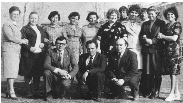
Один из первых коллективов школы

Будучи умелым организатором, он всегда проявлял компетентность, профессиональную состоятельность и ответственность за порученное дело. Активно занимался обобщением и распространением передового педагогического опыта на страницах газеты «Авангард». Писал обзоры, статьи и стихи о школьной жизни и родном крае.